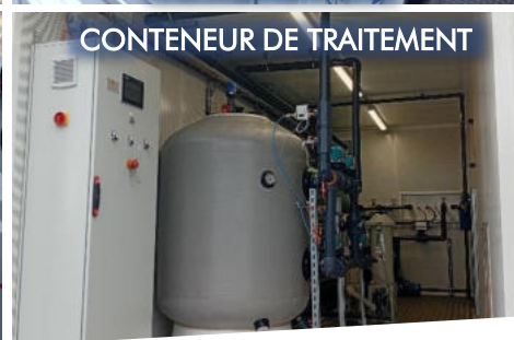
CONTENEUR DE TRAITEMENT