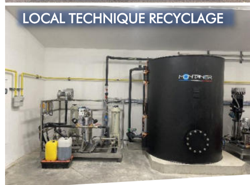
LOCAL TECHNIQUE RECYCLAGE