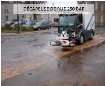
DÉCAPEUSE DE RUE 250 BAR