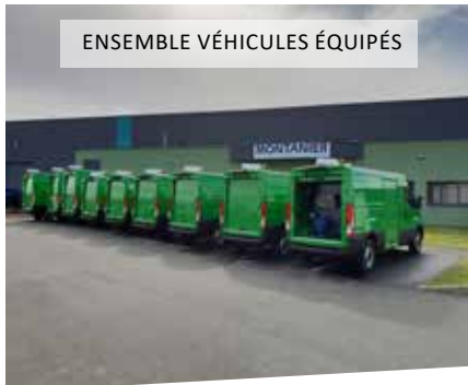
ENSEMBLE VÉHICULES ÉQUIPÉS