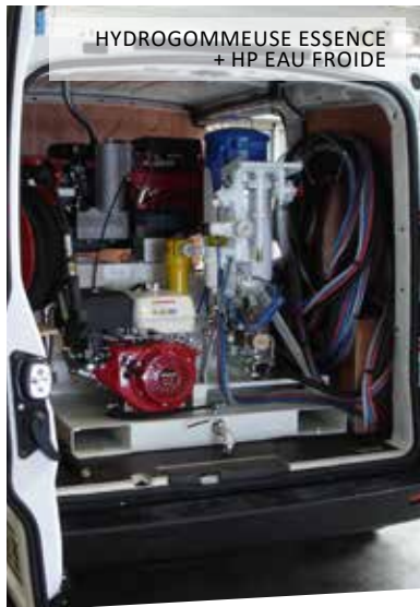
HYDROGOMMEUSE ESSENCE + HP EAU FROIDE