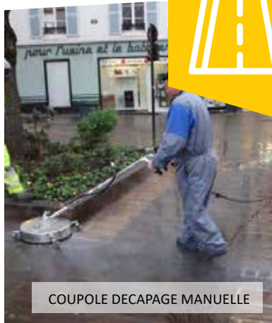
COUPOLE DECAPAGE MANUELLE