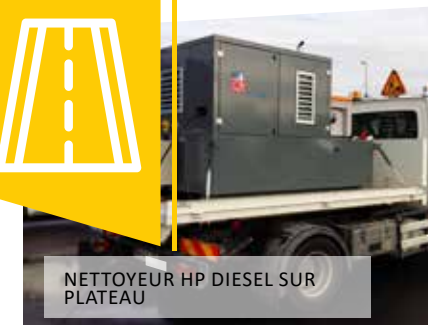
NETTOYEUR HP DIESEL SUR PLATEAU