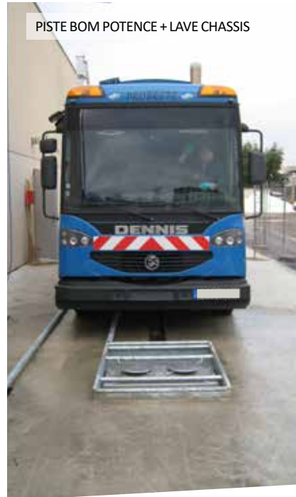
PISTE BOM POTENCE + LAVE CHASSIS