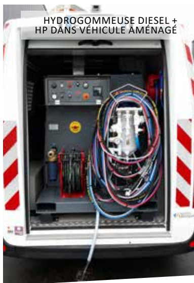
HYDROGOMMEUSE DIESEL + HP DANS VÉHICULE AMÉNAGÉ