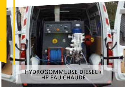
HYDROGOMMEUSE DIESEL + HP EAU CHAUDE