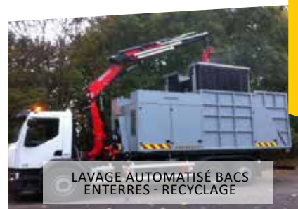
LAVAGE AUTOMATISÉ BACS ENTERRES - RECYCLAGE