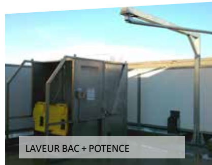
LAVEUR BAC + POTENCE