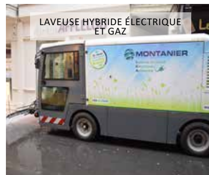
LAVEUSE HYBRIDE ÉLECTRIQUE ET GAZ