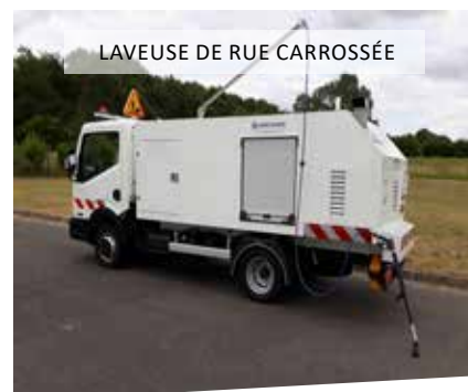
LAVEUSE DE RUE CARROSSÉE