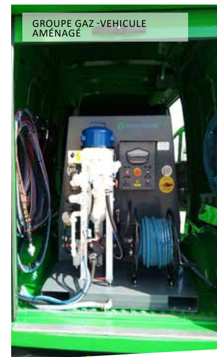
GRUPE GAZ - VÉHICULE AMÉNAGÉ