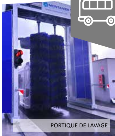
PORTIQUE DE LAVAGE