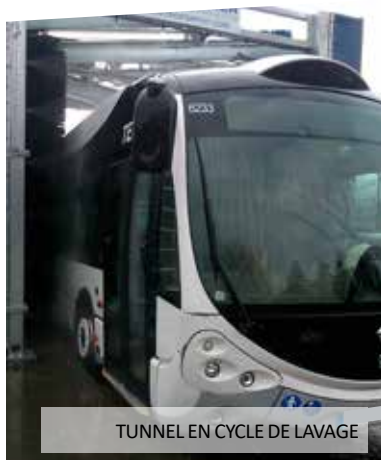
TUNNEL EN CYCLE DE LAVAGE

Le service commercial vous proposera trois types de contrats de maintenance préventives et/ou curatives, selon votre choix : contrat Essentiel, Equilibre ou Sérénité.