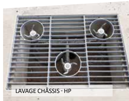
LAVAGE CHÂSSIS - HP