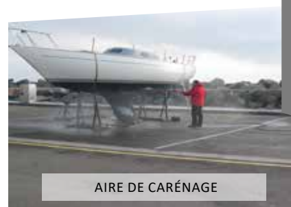
AIRE DE CARÉNAGE