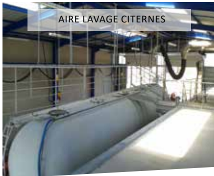
AIRE LAVAGE CITERNES