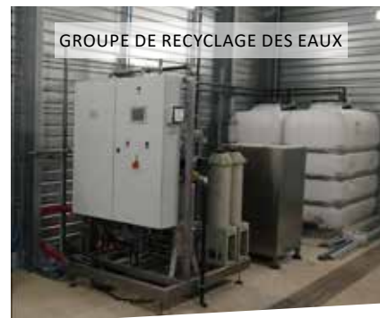
GROUPE DE RECYCLAGE DES EAUX