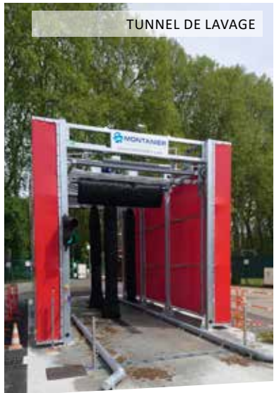
TUNNEL DE LAVAGE