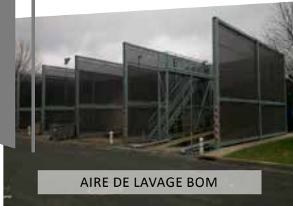
AIRE DE LAVAGE BOM