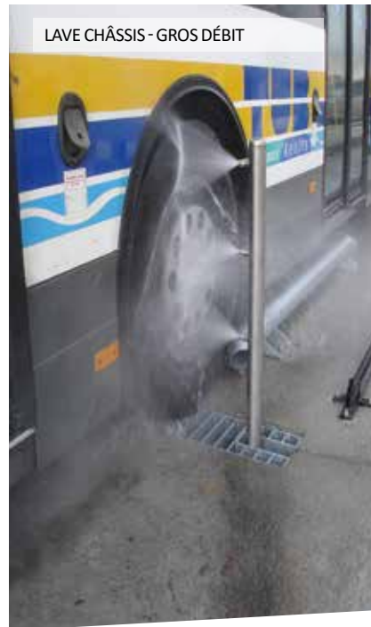
LAVE CHÂSSIS - GROS DÉBIT