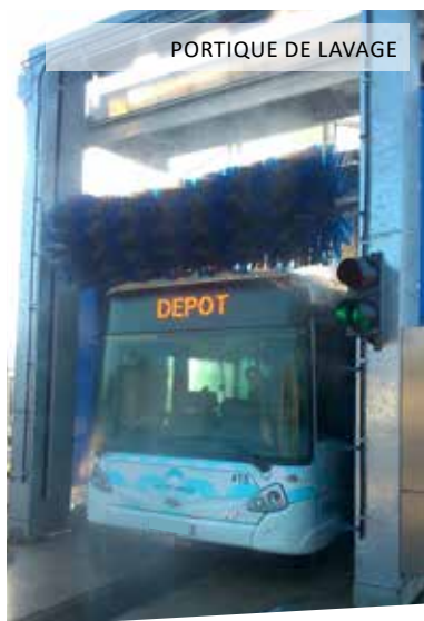
PORTIQUE DE LAVAGE