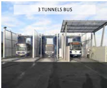
3 TUNNELS BUS